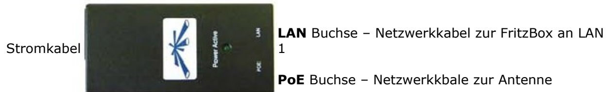
Abb. Stromadapter d. Antenne